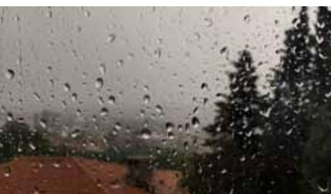
Olga Karlović, Kišni biseri