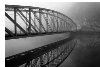
Neda Rački, Put u nepoznato