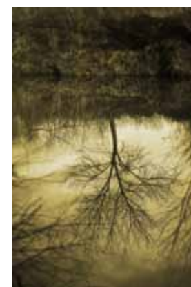
Valentina Bunić Refleksija

Fotografija nije luksuz već društvena potreba.