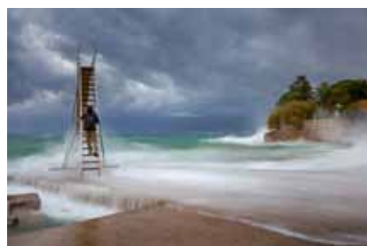
Igor Popović, Climb into storm