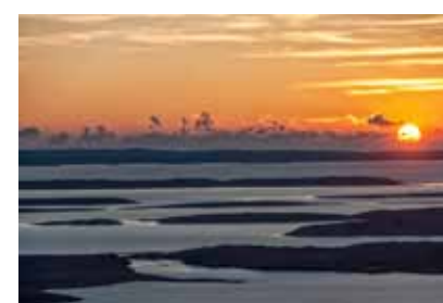
Jerolim Vulić, Prožimanje