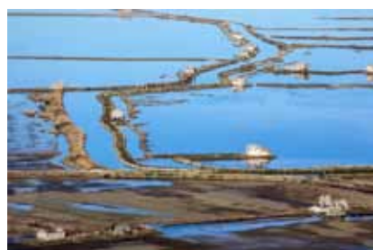
Dušan Miška Soline Salt Pans Sečovlje