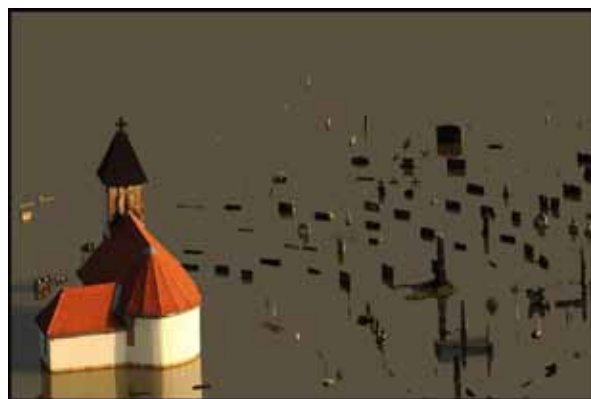
Nenad Reberšak, Poplava