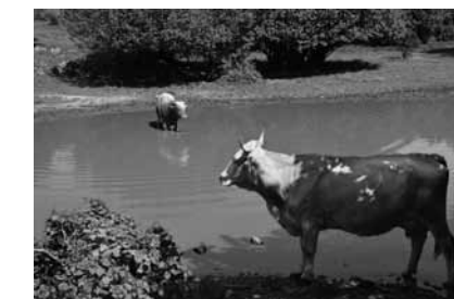
Elma Dujić, Na pojilu