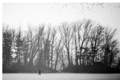
Pavao Toth, Treće agregatno stanje