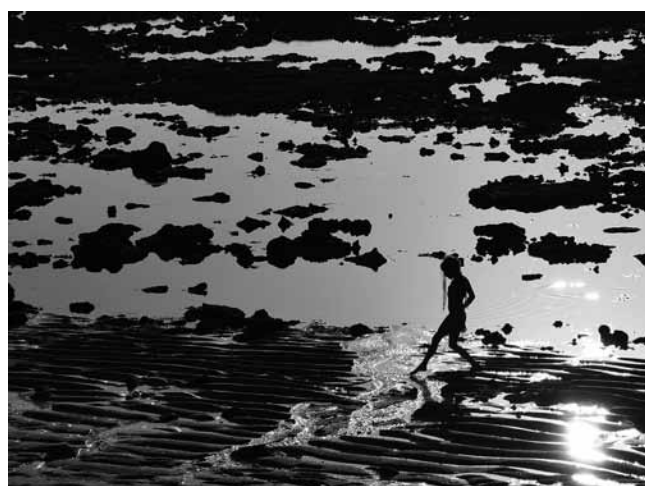
Alja Pregl, Queen of the infinity possibilities