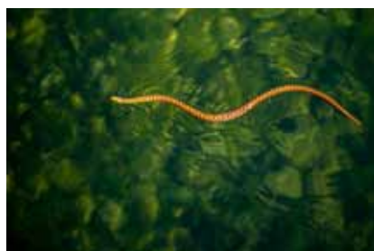
Radoje Elez, Ribarica