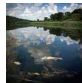
Petar Zembo Poslednji vapaj