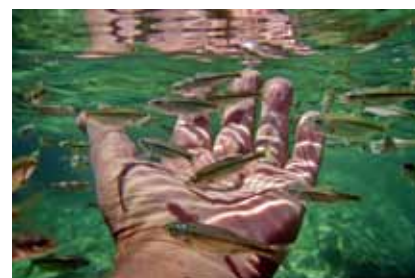
Mihajlo Filipović, Kontakt