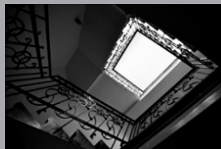
Tomislav Zemanek, Road to hell