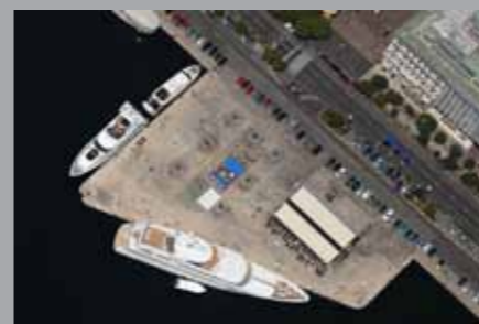
Želimir Černelić, Rijeka 18/18