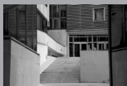
Matea Mirošević, Rijeka 2