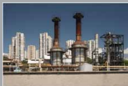
Edvard Primožić, Riječke baklje