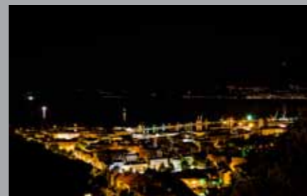
Miro Dezulović, U divnu riječku noć