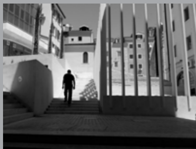
Tanja Ljubojević, Prolaz