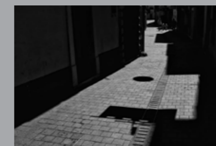
Zoran Uzelac, Točka na i