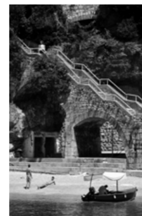
Darko Ivošević, Sabličevo