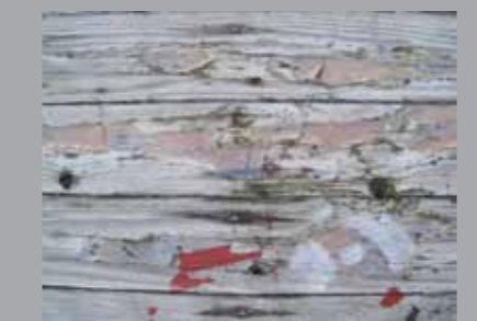
Zdravko Kopas, Kompozicija 1